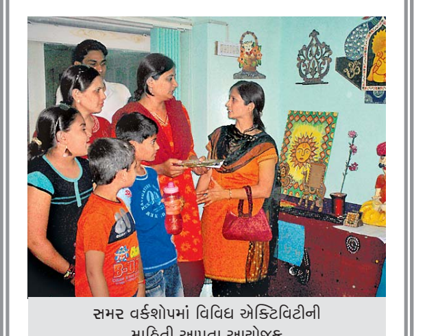
સમર વર્કશોપમાં વિવિધ એક્ટિવિટીની માહિતી આપતા આયોજક

મનના ભાવો પાચકરસોને અસરકારી બને છે. જ્યારે તમારું મન પ્રફલ્લિત હોય છે ત્યારે શરીર તેની તમામ રાસાયણિક ક્રિયા સારી રીતે કરે છે. પાચકરસોની કાર્યશક્તિ અને તેનો જીવન યોગ્ય રીતે થાય છે જે ચરબીનું દહન જલદી કરી શકે છે. આથી વજન ઘટાડવું છે? તો મન પ્રફલ્લિત રાખો. તમે જવું સુંદર સ્વસ્થ શરીર ઇચ્છો છો એની કલ્પના કરો. એ કાલ્પનિક ચિત્રને હંમેશાં નજર સમક્ષ રાખો. તો તમે પાતળા બનવાનું એક પગથિયું સર કર્યું હોવાય.