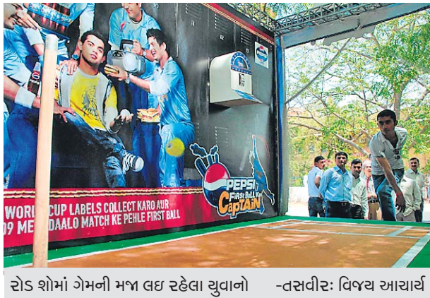
રોડ શોમાં ગેમની મજા લઈ રહેલા યુવાનો

કોઈ ગુજરાતી સમર્થક આઈસીસી ટ્રવેન્ટી૨૦ વર્લ્ડકપની કોઈ એક મેચમાં પ્રથમ બોલ નાખે તો આશ્ચર્ય થશે નહીં સિટી રિપોર્ટર | અમદાવાદ